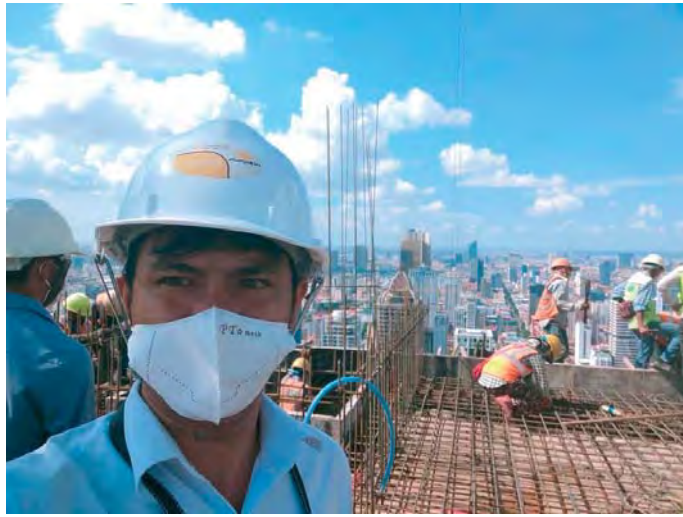
កន្លែងធ្វើការ (ភ្នំពេញ)

ហើយខ្ញុំមានអារម្មណ៍ថាដើម្បីរស់រានមានជីវិត គឺមិនបាន គិតពីអ្នកដទៃតែសោះឡើយ ហើយប្រសិនបើអ្នកពិចារណាពី អ្នកដទៃ គិតថាមិនសូវមានជីវិតរស់ច្រើនឡើយ។ ដោយសារ មេរៀនបែបនេះហើយ ធ្វើអោយចិត្តរបស់ខ្ញុំមានអារម្មណ៍ សប្បាយដែលអធិប្បាយដោយលោក Reiji Umetsu មាន ទឹកចិត្តជ្រះថ្លាណាស់សម្រាប់ការផ្តល់ដំបូលមាន ដែលធ្វើអោយខ្លួនមានសុភមង្គល ដោយពាក្យ គិតអ្នកដទៃជាចំបង គឺវា មានអារម្មណ៍ថាសំខាន់ណាស់។ បន្ទាប់ពីបទពិសោធន៍នេះ រាល់ពេលលោក Reiji Umetsu មកប្រទេសកម្ពុជាម្តងៗ ខ្ញុំ បានសិក្សាអំពីការបណ្តុះបណ្តាលរបស់អង្គារ វិស្សកូសេកៃ ជាពិសេសគឺការប្រតិបត្តិការបង្រៀនរបស់ព្រះសម្មាសម្ពុទ្ធ