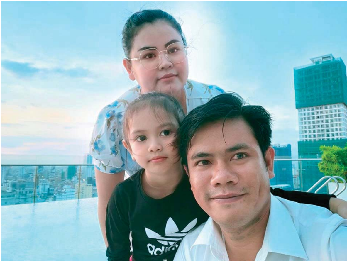
ជាមួយសមាជិកគ្រួសារ (ភ្នំពេញ)

ខ្ញុំសូមថ្លែងនូវសេចក្តីដឹងគុណយ៉ាងជ្រាលជ្រៅចំពោះ លោកប្រធានស្ថាបនិក ដែលបានទុកការបង្រៀននេះ ដល់ពួកយើង ។ ការសម្តែងរបស់សូមបញ្ចប់ត្រឹមតែ ប៉ុណ្ណោះ ! សូមអរគុណច្រើនចំពោះអ្នកទាំងអស់គ្នា។