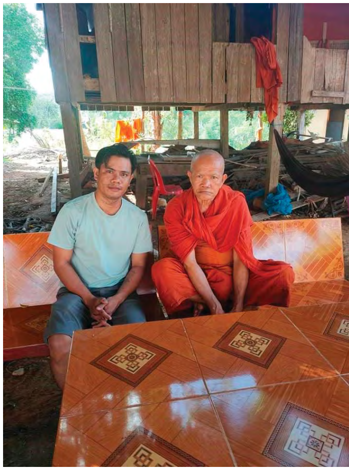
ជាមួយលោកឪពុក(បាត់ដំបង)

នៅឆ្នាំ២០១២ ខ្ញុំបានមដល់ប្រទេសជប៉ុន ដើម្បីបន្តការសិក្សានៅ ហ្គាតឺរីន ពេលនោះចាប់ផ្តើមជីវភាពនៅទី