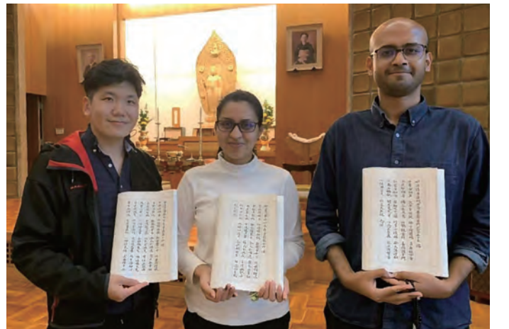
ऊमे सेइदो दोजोमा धर्मा प्रचार तालिममा सुत्र लेख्दै लियडेजी ।

यी २ लक्षलाई नबिसी श्री लंकामा फर्केपछी पनि मुस्कानकसाथ भक्ती र मेहेनत गर्दै जान्छु भनेर प्रण गर्दछु । सुन्नु भएकोमा धेरै धन्यवाद ।