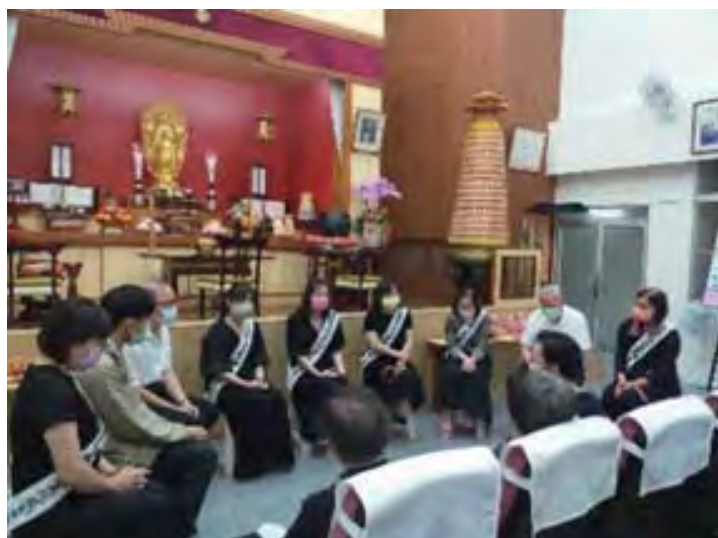
參加法座的陳女士（右邊第4位）

雖然現在我對佛法還懵懵懂懂但是我也抱著做作看的精神，誓願以佛法及佼成教義去引導更多年輕朋友來習佛，一起以歡喜心走上佛道。