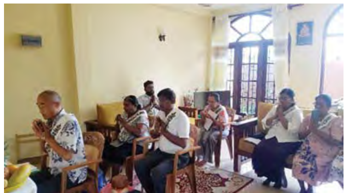
在科倫坡地區誦經供養

從隔天開始，我對工作的態度有了改變。比任何人都早去市場，首先從打開倉庫開始，詢問客人的訂單等，在同事來之前安排好了工作的程序。那個是對自己的生活方式覺醒瞬間。因為開祖恩師的話讓我覺醒了。那結果呢。工作變得很開心，很快樂。新的客人也逐漸增加，覺得越做越有意義了。