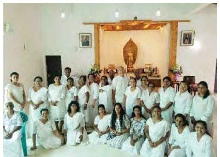
Posonpoya Day (佛教傳入斯里蘭卡的日子) 和斯里蘭卡教會的各位