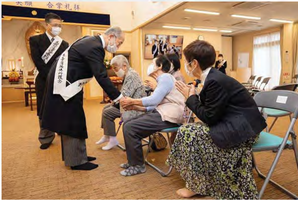
立正佼成會會長 庭野日鏡