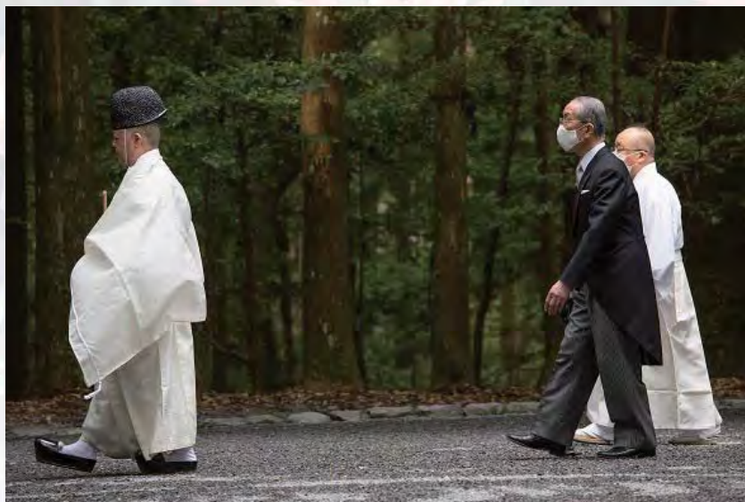
Поч. Ничико Нивано Претседател, Ришо Косеи-каи