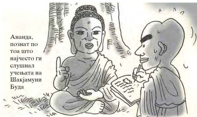
Ананда, познат по тоа што најчесто ги слушал учењата на Шакјамуни Буда