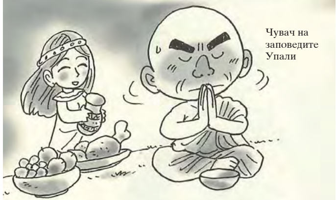
Чувач на заповедите Упали