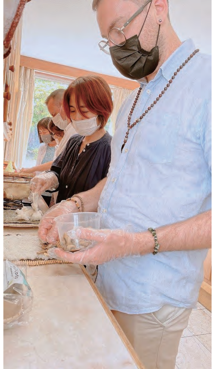
उरानबोन उत्सव समारोह पछि एक कार्यशालामा संघका साथिहरूसँग रोल सुसी बनाउन प्रयास गर्दै

अन्तमा मलाई अहिलेसम्म सहयोग गर्नु भएको संघ र परिवारप्रती मन देखी नै आभारी छु भन्ने कुरा भन्न चाहन्छु । सुन्नु भएकोमा धेरै धन्यवाद ।