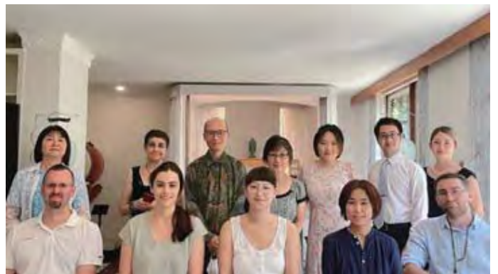
Cùng với các bạn tăng già của Trung tâm Luân Đôn

Và điều quan trọng hơn hết thảy là việc thực hành những lời dạy hết lần này tới lần khác trong một thời gian dài và làm cho những hạt giống của phật lớn lên. Trong Kinh Pháp Hoa có viết rằng sự tu hành của bồ tát sẽ tiếp tục diễn ra trong một thời gian rất dài.