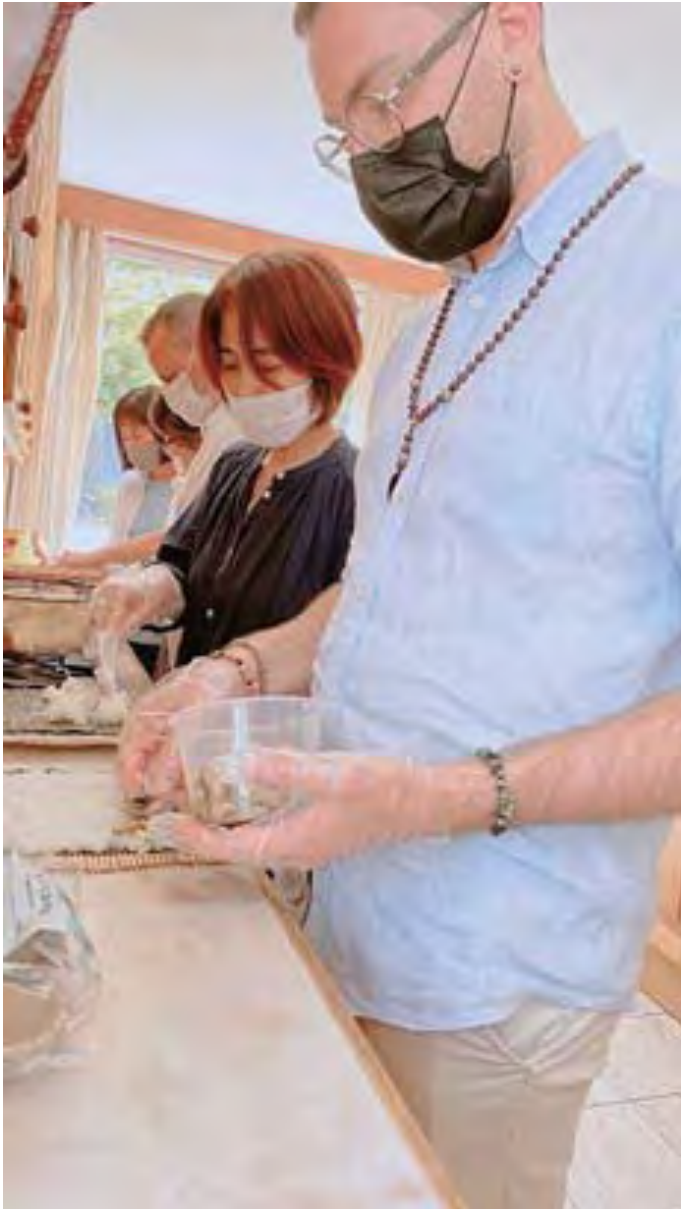
Các bạn tặng già thử sức làm sushi cuộn tại lớp học làm sushi sau Nghi thức Lễ Vu Lan

Cuối cùng, tôi muốn truyền tải cảm xúc biết ơn từ tận đáy lòng đối với gia đình và các bạn tặng già, những người đã nâng đỡ tôi trong suốt cuộc đời cho tới lúc này. Tôi xin cảm ơn mọi người đã dành thời gian lắng nghe ạ.