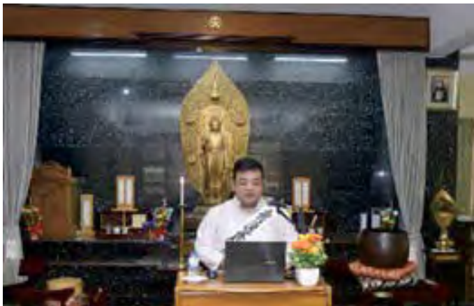
Ảnh Sauman thuyết pháp tại “Đào tạo nhân viên phụng sự khu truyền đạo Nam Á năm 2022”.

Năm 1993, tôi mồ côi cha khi đang học năm thứ 3 trung học cơ sở. Kể từ đó trở đi, tôi đã trải qua nhiều khó khăn gian khổ khác nhau trong cuộc đời. Thời niên thiếu nghèo khó mất đi người cha là lao động chính trong nhà, tôi đã luôn nghĩ rằng nếu được ăn ba bữa mỗi ngày thì sẽ hạnh phúc nhường nào. Tuy nhiên, bây giờ nghĩ lại thì cuộc sống khổ sở trong khoảng thời gian này là một kinh nghiệm đáng biết ơn đã chỉ dạy cho tôi một hạt gạo đáng quý tới mức nào.