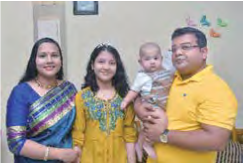
Cùng với vợ, con gái và con trai sinh vào tháng 3

Kể từ khi tốt nghiệp trường tăng lữ, lần này là lần đầu tiên tôi được thuyết pháp trải nghiệm. Tôi xin bày tỏ lòng biết ơn chân thành đối với tất cả mọi người vì đã lắng nghe tôi nói trong suốt một thời gian dài. Tôi xin cảm ơn tất cả mọi người ạ.