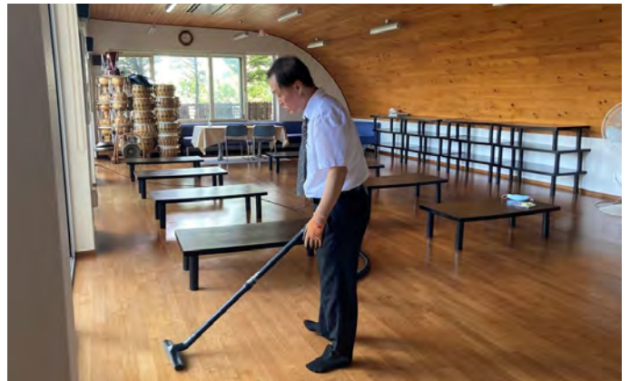
在教會努力於健幸行的徐先生