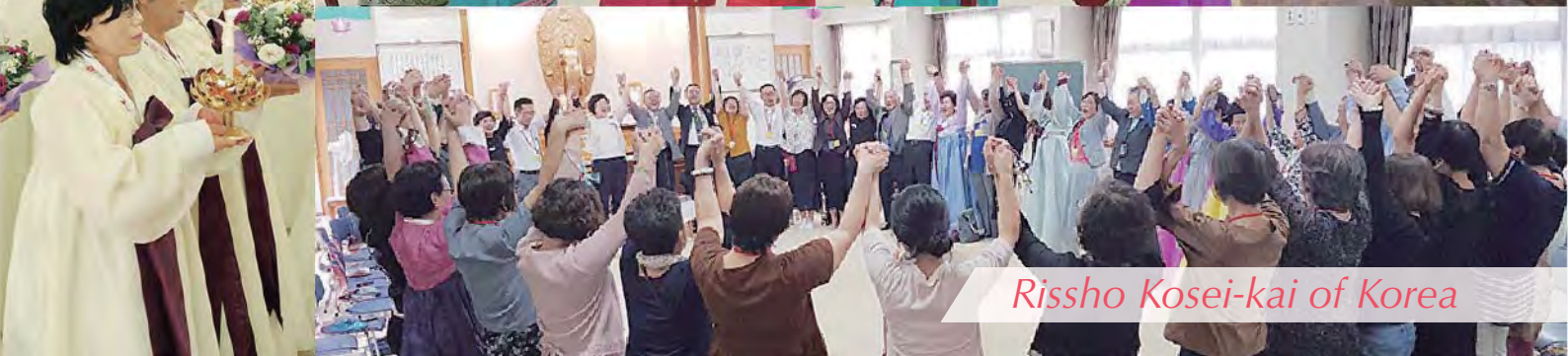
Rissho Kosei-kai of Korea