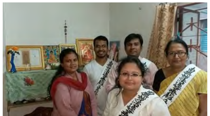
Cùng với người chủ trì lễ an trí bản tôn tại nhà cha mẹ của chị Mutsuddi

Khoảng thời gian đó, tôi bắt đầu cảm thấy việc điều trị hiếm muộn là một gánh nặng cả về thể chất lẫn tinh thần, và tôi hỏi ý kiến ông Shumon rằng “Em không còn đủ sức mạnh tinh thần để tiến hành việc điều trị hiếm muộn nữa. Em định chuẩn bị việc nhận con nuôi”. Lúc đó thì ông Shumon nói với tôi “Việc dẫn đường chỉ lối là sự tu hành tuyệt