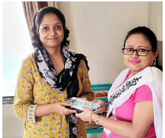
Lễ an trí bản tôn của nhà Ronita

3. Tôi sẽ tiếp tục duy trì tấm lòng yêu thương đối với những người ghét tôi hay những người mà tôi không thể xây dựng được mối quan hệ tốt đẹp cho dù đang ở gần hay đang ở cách xa họ. Và tôi nghĩ rằng bản thân những người như thế cũng đang tiếp xúc một cách khát khe với tôi chính vì họ đang có những nỗi khổ não, và tôi sẽ mang tấm lòng từ bi với họ. Tôi mong mỗi rằng tâm hồn của những