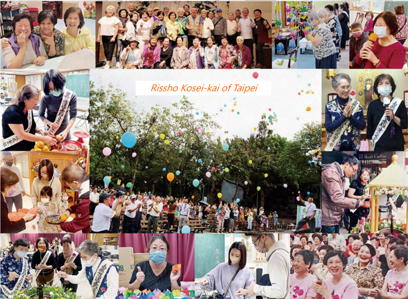
Rissho Kosei-kai of Taipei