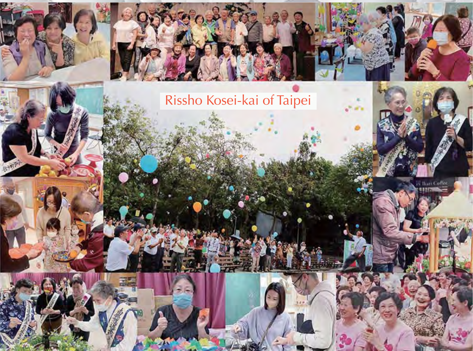
Risho Kosei-kai of Taipei