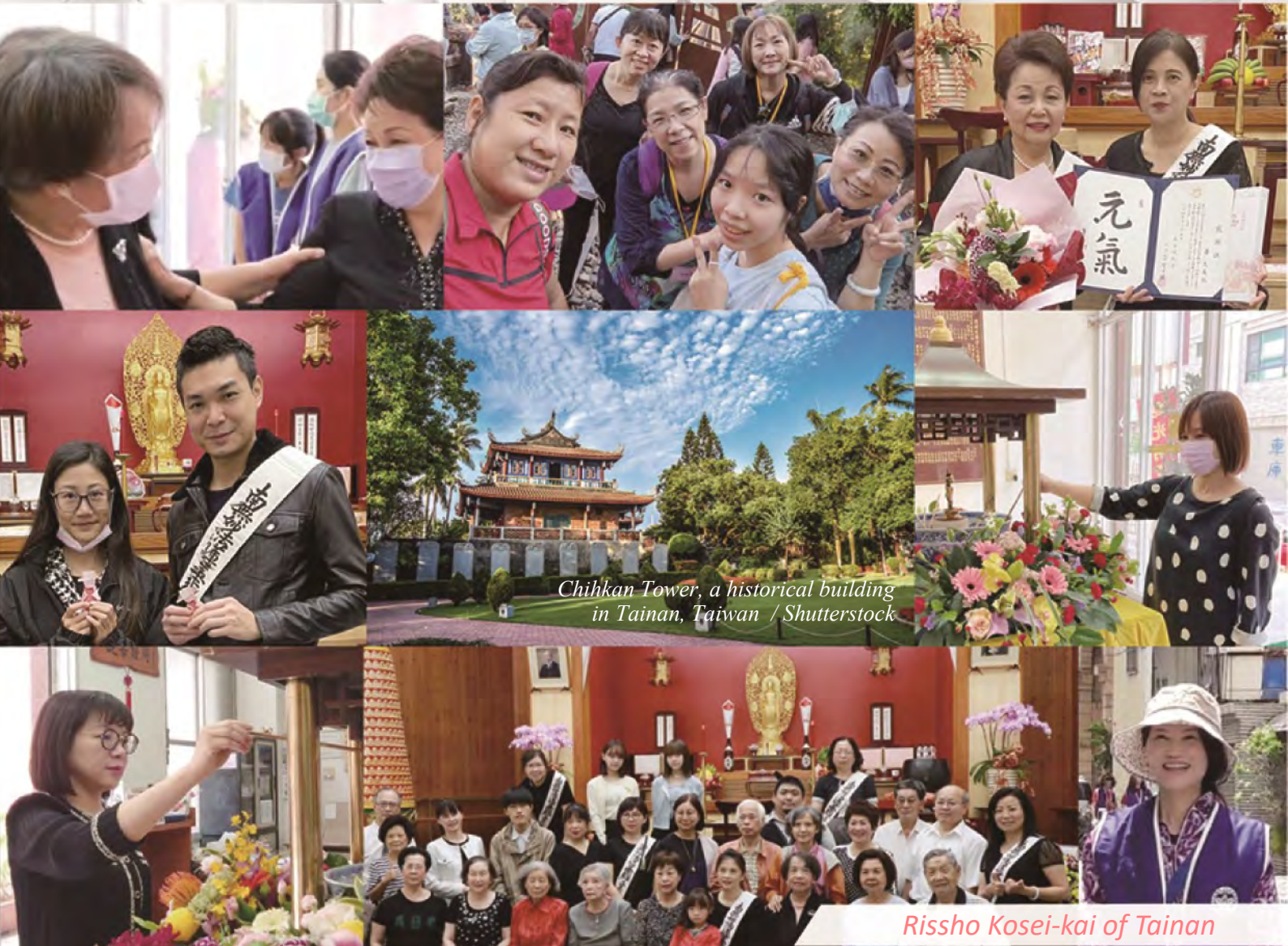
Chihkan Tower, a historical building in Tainan, Taiwan