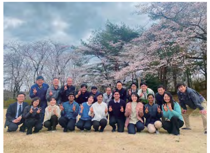
Cùng với mọi người ở trường tăng lữ trước khi về nước (hàng đầu, thứ 4 từ phải sang)

Sau khi tốt nghiệp trường tăng lữ thì tôi muốn giúp ích cho mọi người ở Bangladesh — Tôi đã đến Nhật với mong ước như thế. Để biến mong ước đó trở thành hiện thực, từ nay trở đi tôi cũng sẽ tiếp tục tinh tấn hết sức mình mà không quên cảm xúc biết ơn. Như là bước đầu tiên, tôi sẽ thành lập một nhóm thành viên ban thanh niên bên trong giáo hội Bangladesh và tiến hành các hoạt động để truyền đạt những hành động tín ngưỡng căn bản và tinh thần và hình thức của việc cúng dường cho các bạn thanh niên một cách vui vẻ và tươi sáng. Trong báo cáo nghiên cứu tốt nghiệp trường tăng lữ thì tôi đã thề nguyện rằng mình sẽ nỗ lực hành động trong 4