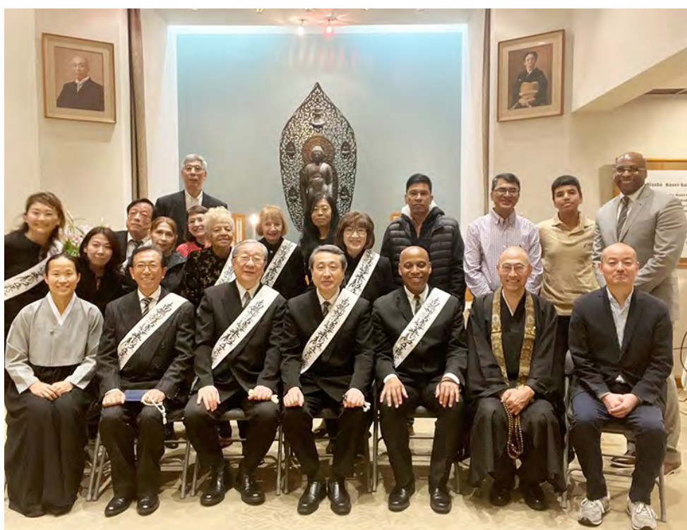
紐約教會長就任式之際和會員一起（前排右邊第3位）

今後今後也將繼續尊重和珍惜向我們傳達佛陀教義的日本人僧伽的存在，他們是教會的歷史根源。並且，正如紐約市長亞當斯所期待的那樣，我們僧伽將繼續共同努力團結一心，將佛法更進一步的推廣到紐約，透過佛教改變紐約的街道，並改變世界。