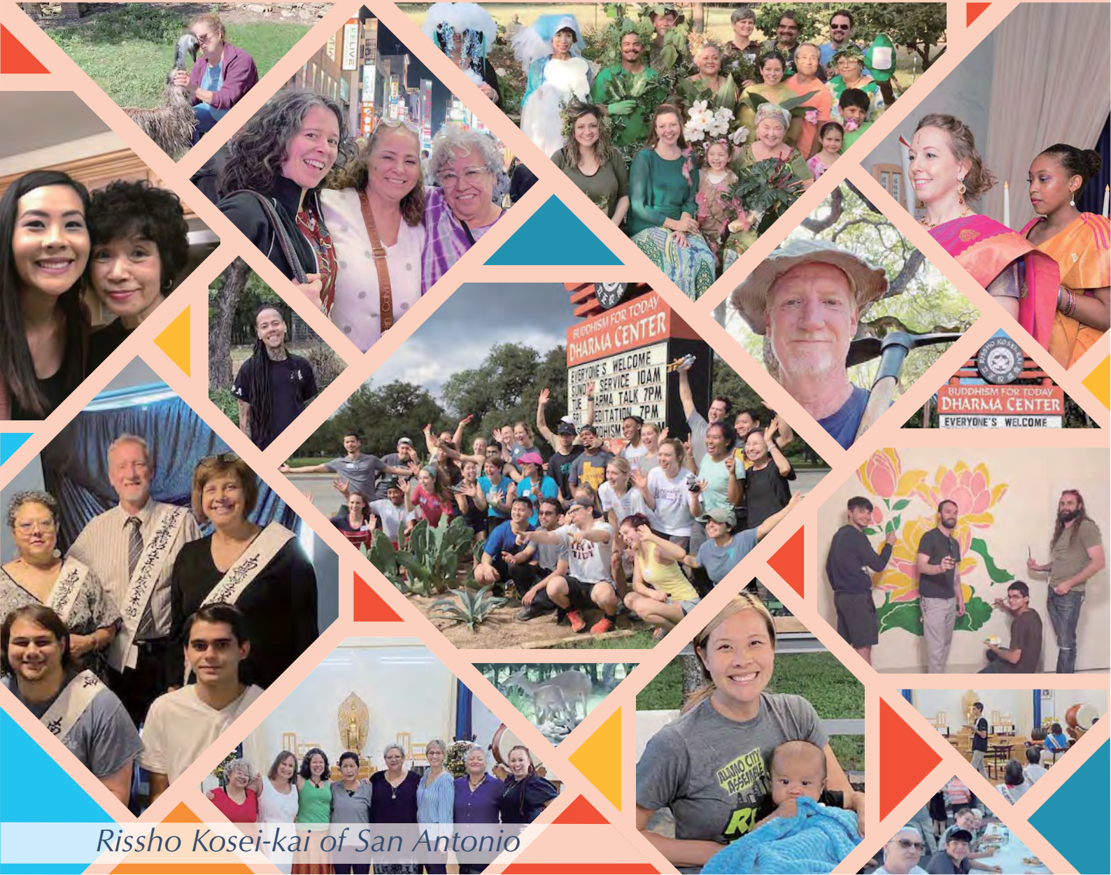
Rissho Kosei-kai of San Antonio