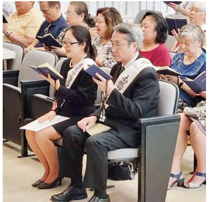
巴西教會長就任儀式時的誦經供養

的教會工作人員，擔任根本佛教和法華經學習會的講師。從20年前開始，為了向一般市民廣泛推廣法華經，教會長擔任講師實施「佛教研習會」，我擔任翻譯。這個研習會完全不使用佛教用語，活用開祖恩師的法話，如「首先為他人」「自己先改變對方也會改變」，讓初學者也簡單易懂的內容。