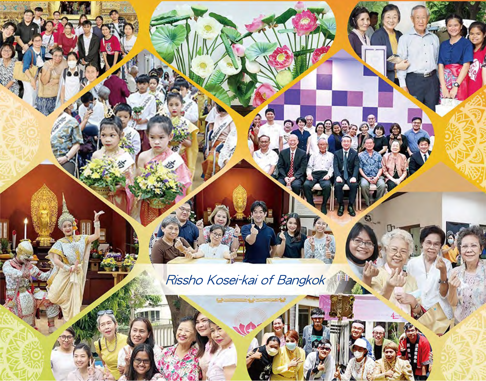
Rissho Kosei-kai of Bangkok

Living the Lotus Vol.221 (February 2024)