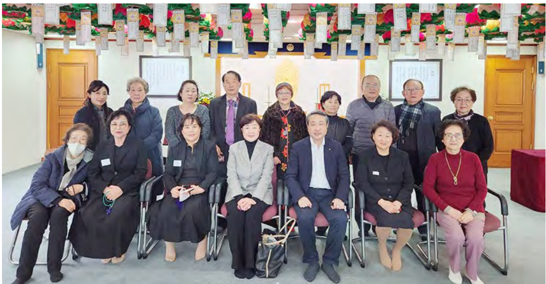
2024年1月10日，出席韓國教會釜山支部交流會的赤川部長（前排右起第3位）

話說回來，在2月的會長法話中，有包含今年的年頭法話中的「敬畏和知恥」的概念中，提出了「羞耻之心」。會長先生早在四分之一世紀前開始就一直在指導「耕耘心田」的重要性，希望今年透過每月的法話，以「耕耘心田」為主題，進一步詳細地指導我們其意義和方法。會長先生指出，「羞耻心」和佛性一樣是每個人都具備的。我將虛心地接受這句話，來度過活在法華經的一年。