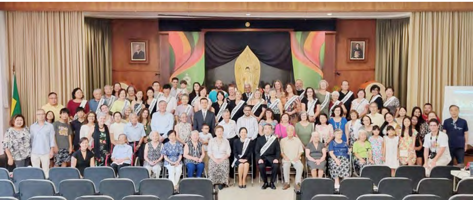
巴西教會長就任儀式後和僧伽一同的合影(最前排中央)

今後，想要送出更多的學林青年，致力於培養下一代傳承人才。另外，今年我們會員一直期盼已久的葡萄牙語版《法華三部經》即將完成。我想把《法華三部經》作為巴西佈教新開始的基礎，為了更多人的幸福，團結一心的教會，向佈教傳道邁進，在巴西全土綻放佛法之華——這就是我現在的夢想。