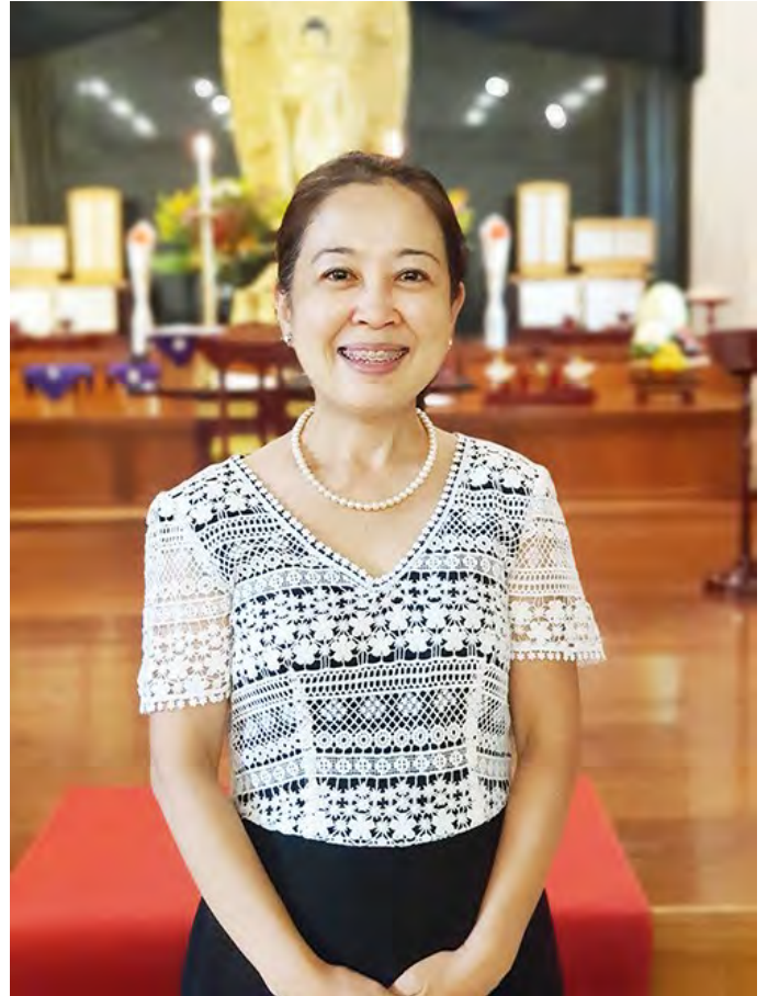
巴西教會成立50週年紀念典禮時的道場

1971年出生於巴西。信仰第三代。畢業於聖保羅麥肯錫大學。1998年從立正佼成會學林本科畢業後，被派遣到東京的大田教會作為佈教員2年。之後，擔任巴西教會的佈教員，2012年起擔任巴西教會教務部長。2023年12月就任巴西教會長。