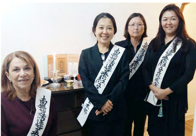
與僧伽一同在巴西教會會員家的合影

之後每年7月，為了促進巴西和日本文化的相互理解和與區域的交流，在教會用地內舉辦了「農產收穫祭」。開設了日本炒麵、天婦羅、巴西代表性料理串燒烤肉等小吃店，得到了教會周邊大眾的好評。