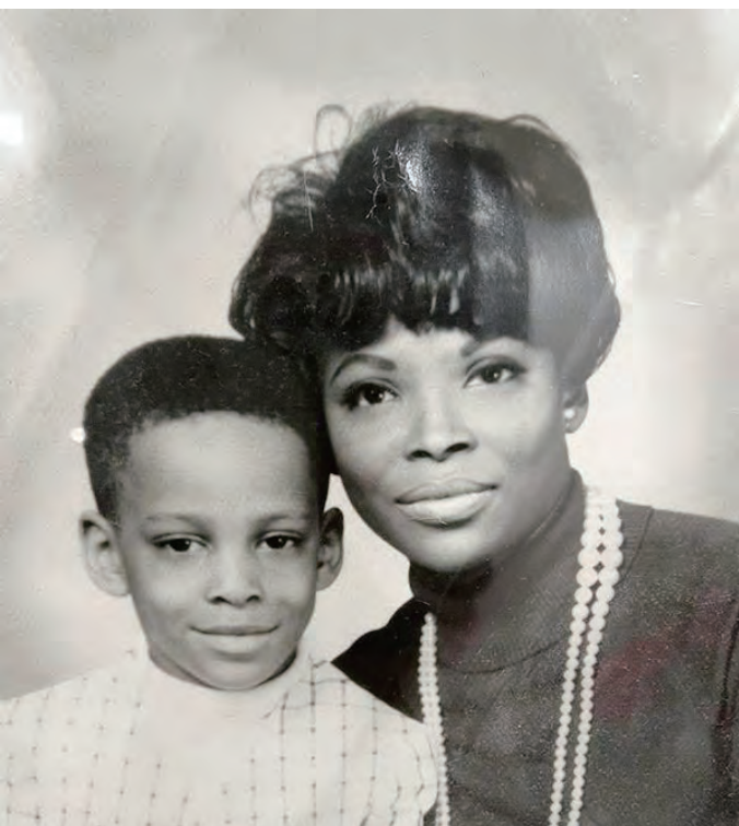
स्वर्गीय आमा मरियान

साथमा म रिशशो कोसेइ काइबाट बाह्य-निर्देशककोरूपमा न्यूयोर्क बुद्धधर्म परिषदको सदस्य बने र यो शहरका बिभिन्न सामाजिक कार्यक्रममा भाग लिदै आएको छु । यो बुद्धधर्म परिषदमा बिभिन्न बुद्धधर्मका संस्थाहरू आबद्ध छन । यो साएद अमेरिकामा भएको सबैभन्दा ठुलो बुद्धधर्मको संस्था हो जहाँ जापान, कोरिया, चिन ताईवान र अरुदेशका ८० संस्थाका करिब ८लाख सदस्यहरू आबदा छन । म यहाँको अध्यक्षकोरूपमा हिरोशिमा र नागासाकिमा आणविक बममा परी ज्यान गुमाउनेहरूको स्मृती समाहरोह र एसियाका मान्छेप्रती हुने रङभेद साथसाथै अफूकी अमेरिकिप्रती हुने भेदभाव बिरुद्ध शान्ति पदयात्रा जस्ता बिबिध कार्यक्रम गरेको