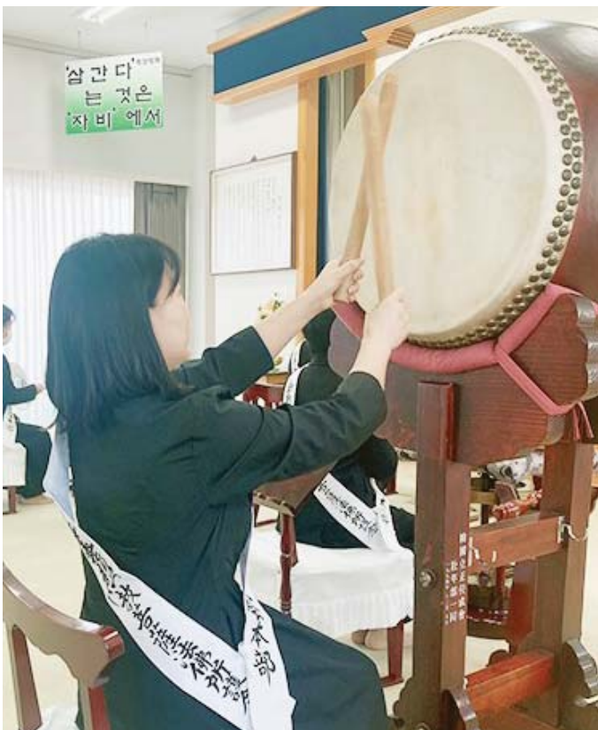
在教會的式典上擔任打太鼓任務的崔女士

另外一位朋友是C女士，是在當地的羽毛球運動俱樂部認識的人。我抱著一定要引導C女士的願望，邀請C女士來過教會一次。但是，我想讓他入會的想法太強烈了，因為對C女士的關心不夠，因此她漸漸地遠離了教會。覺得很對不起C女士現在正在反省。我透過這次的體驗，學會了貼近關懷對方的心，親切地傾聽對方說話的重要性。