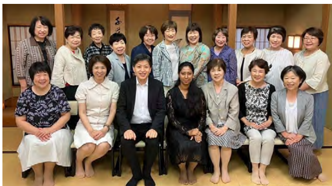
在佈教實習地的福井教會與會員們合照

以前的我從未想過畢業後的希望在立正佼成會俸職。但是，在佈教實習的福井教會，每天都看到信徒們的佈教活動和奉獻的姿態，《我該怎麼做才能報答開祖恩師和會長先生的恩情？》的想法越來越強烈了。回到孟加拉後，想將在學林學到的東西在工作 and 教會活動中活用並實踐，為了更深入地學習文化和宗教也有考慮出國留學等多種選擇。