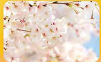
Rishso Kosei-kai of Seattle