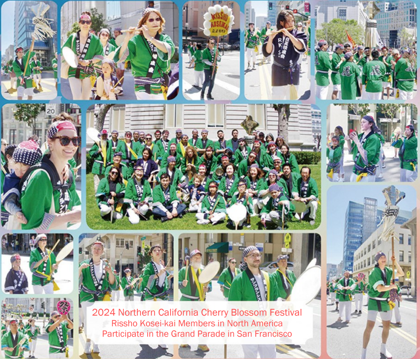
2024 Northern California Cherry Blossom Festival Risho Kosei-kai Members in North America Participate in the Grand Parade in San Francisco