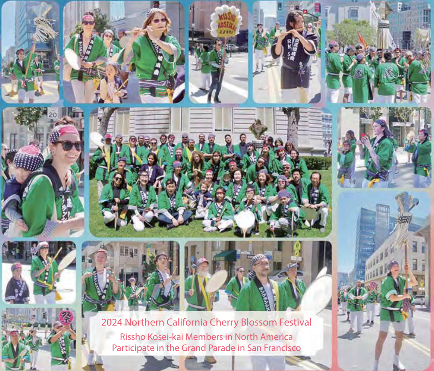
2024 Northern California Cherry Blossom Festival Rishsho Kosei-kai Members in North America Participate in the Grand Parade in San Francisco