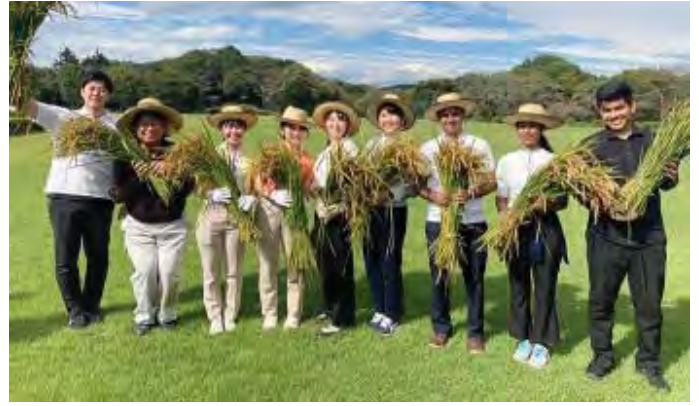
गाकुरिनका विद्यार्थीले रोपेको धान काट्दै (दाहिनेबाट तेस्रो बिश्वजितजि)

साथमा मैले गाकुरिनमा सिकेको ‘सबै मानिसलाई सम्मान गर्ने’ भन्ने बुद्धधर्म र पुण्डरिक सुत्रको उपदेश सकेसम्म धेरैमा फैलाउन चाहन्छु। ठोस रुपमा मेरा छिमेकि दलित बालबालिकालाई स्टेसनरि दिने, पढ्न सिकाउने, खेलकुद आदी गरेर घुलमिल गर्न चाहन्छु। उनिहरूले शिक्षा पाएमा उनिहरूले आफ्नो अधिकारको बारेमा सिक्छन र मानवको रुपमा बिकशित हुन सक्छन भन्ने बिश्वास छ। अनि क्रीकेट या