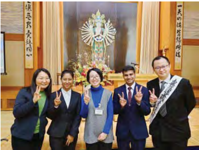
गाकुरिनका शिक्षक र सहपाठिसँग (होरिनकाकु गेस्टहाउसमा देब्रेबाट दोस्रो बिश्वजितजि)

सबैभन्दा महत्वपूर्ण लागेको “प्रतियासम्भपद” हो जुन बुद्धधर्मको एक आधारभुत उपदेश हो। हाम्रो जिवनिमा केहि समस्या आएमा हामी अरु या प्रकृतिलाई दोष दिने गर्छौं। तर एसले स्थितिलाई केहि परिवर्तन गर्दैन। स्थितिलाई सुधार गर्न हामीले कस्तो सोचाइ राख्न पर्छ त? मानव संबन्धको कुरामा हामीले अरुलाई परिवर्तन गर्न सक्दैनौ तेसैले पहिला आफुलाई नै परिवर्तन गर्नु पर्छ किनकी हामी नै कारक हौ। यो उपदेशबाट मैले आफ्नो खुशी भनेको आफ्नै हातमा हुने रहेछ भन्ने कुरा सिकेको छु।