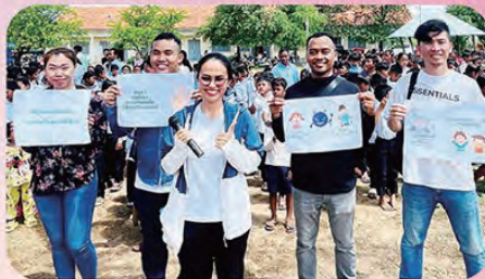
Rissho Kosei-kai of Phnom Penh