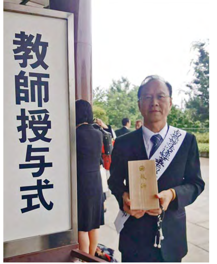
२०१८मा प्रशिक्षक योग्यता प्रमाणपत्र बितरणमा लोजि