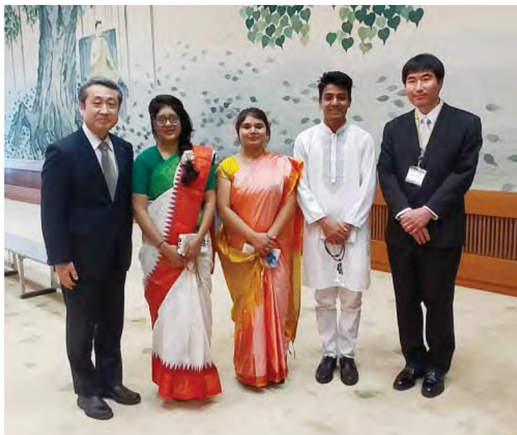
२०२४ अप्रिल ६मा गाकुरिन बिद्यालयको भर्ना हुने बिदेशी विद्यार्थीसँग (होरिन्कान हलमा)

हाम्रा अध्यक्षले “आफ्नो जिवनशैली र प्रवृत्ति” नै “अमरत्वको एक रूप हो” भनेर सिकाउनु भएको छ । मैले जस्तै संस्थापकसँग “संबन्ध” राख्न मौका पाएकाहरू प्रतेकले शान्तपूर्ण मन गरेर नमन गरी हरेक दिन बिताउन सक्नु भनेर कामना गर्दछु ।