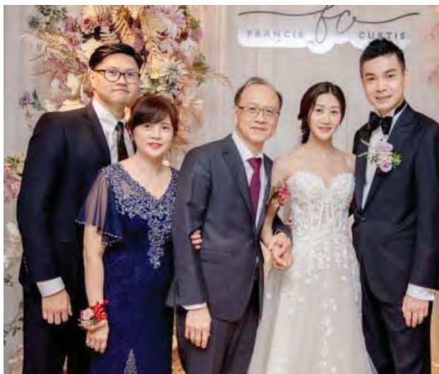
२०२३ जुलाई १मा छोरीको बिहेको बेलामा परिवारसँग

एस्कोनिम्ती पनि ताइनन मन्दिरका सदस्यहरुले यो सुन्दर पुण्डरिक सुत्र सिकेर आफ्ना परिवार, अफिस र समाजमा उपदेशलाई अभ्यास गरी हिलोमा फुल्ने कमल झै हरेकको मनमा सुन्दर फुल फुलाएर जिवित जिवन बिताउन सक्नु भन्ने कामना गर्दछु । म पनि हरेक दिन भक्ती र ध्यान जारी गरी मेर कार्य देखी मानिसले “तिमी ले के आस्था गछौं ?” भनेर सोध्दा “रिश्शो कोसेइ काइ को आस्थ राख्छु” भनेर जवाफ दिन सक्ने गरी मेहेनत गर्दै जानेछु । आदर्श धेरै भयो भन्नु होला तर पछिबाट अरुलाई नेतृत्व गर्न सक्ने मानिस बन्नु सकौ भन्ने मेरो अहिले को लक्ष्य हो ।