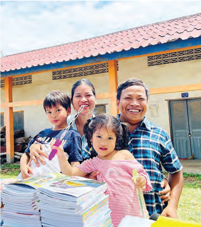
सोर सोङ्हेङ्जी परिवारसँग (दाहिने)

२०१५मा मैले यो पद पाएको हु र एसैको कृपाले अरु सदस्यलाई तेदोरी गर्ने अनि होजाद्वारा धर्मको कुरा सिक्ने मौका पाएको छु । सदस्यलाई दिनु पर्ने जनकारिआदिलाई अचेल SNS प्रयोग गर्दा सजिलो र भरपर्दो भएको छ । तर मलाई तेदोरी भनेको आफुलाई अझ उच्च बनाउने तालिम हो र अरुलाई मन बाढ्ने बोधिसत्व कर्म हो भन्ने लागेकोले काममा भ्याएसम्म सदस्यको घर भ्रमण गर्ने गरेको छु । र भेटेर “सबै ठीक छ ? काम कस्तो चली रहेको छ ?” भन्ने जस्ता कुराहरु सोध्ने गरेको छु । यो नायकको पदको काम मैले अझै राम्रोसँग गर्न सकेको छैन र सिकन पर्ने कुरा धेरै छन तर यो काम बुद्धले दिएको अमुल्य र सम्मनजनक कर्म हो भनेर खुशी र कृतज्ञ छु ।