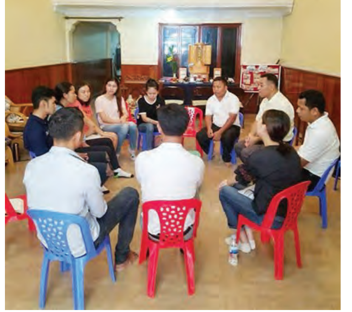
फुनपेन होजाका सदस्यहरूसँग (बिच दाहिने पछील्लिर)