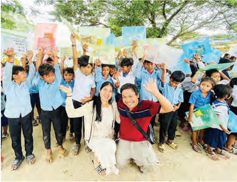
शैक्षिक सामग्री पाउने बिद्यार्थिसँग

मैले कोसेइ काइको “एक भोजन दान” कार्यक्रम जस्तै गरी अहिले प्राथमिक बिद्यालयका विद्यार्थीलाई शैक्षिक सामग्री प्रदान गर्ने काम गरेको छु तेस्लाई र अझ अघी बढाउछु भन्ने छ । साथमा “पहिला अरुहरु” भन्ने बोधिसत्व भावनलाई मनन गरी क्याम्बोडियाको जनाताको खुशिको कामना गरी बुद्धको उपदेश अझ फैलाउन कडा मेहेनत गर्छु भन्ने लागेको छ ।