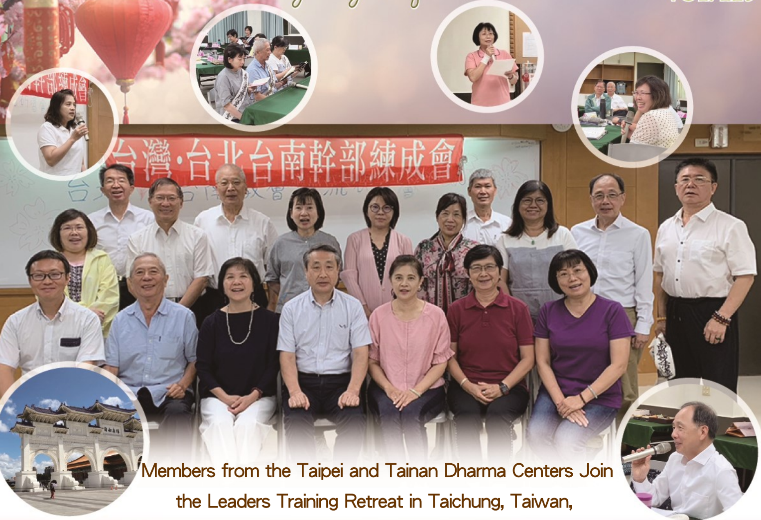
Members from the Taipei and Tainan Dharma Centers Join the Leaders Training Retreat in Taichung, Taiwan, from September 8 to 10, 2024