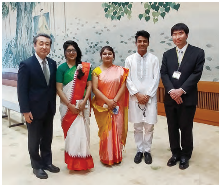
Гакүрин сургуулийн гадаад оюутны ангийн элсэлийн ёслол 2024.04.06

“Хүний амьд ахуйдаа туулсан амьдралын замнал, хүн чанар нь хүмүүсийн зүрх сэтгэлд хадгалагдан үлдэх нь үхэшгүй мөнхийн нэг хэлбэр” гэж ерөнхийлөгч айлдсан. Би ч бас Үүсгэн байгуулагчийн нэгэн адилаар хувь тохиолоор учирсан бүх хүмүүсийг уужуу сэтгэлээр хүндлэн мөргөж өдөр бүрийг өнгөрөөхийг хүсэж байна.