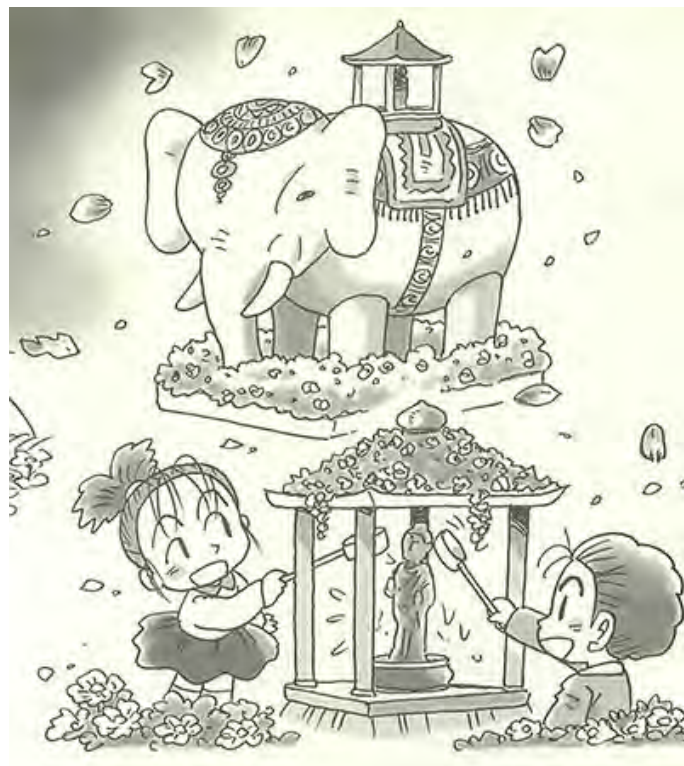
Бурхан багшийн мэндэлсэн өдөр (12 сарын 8)