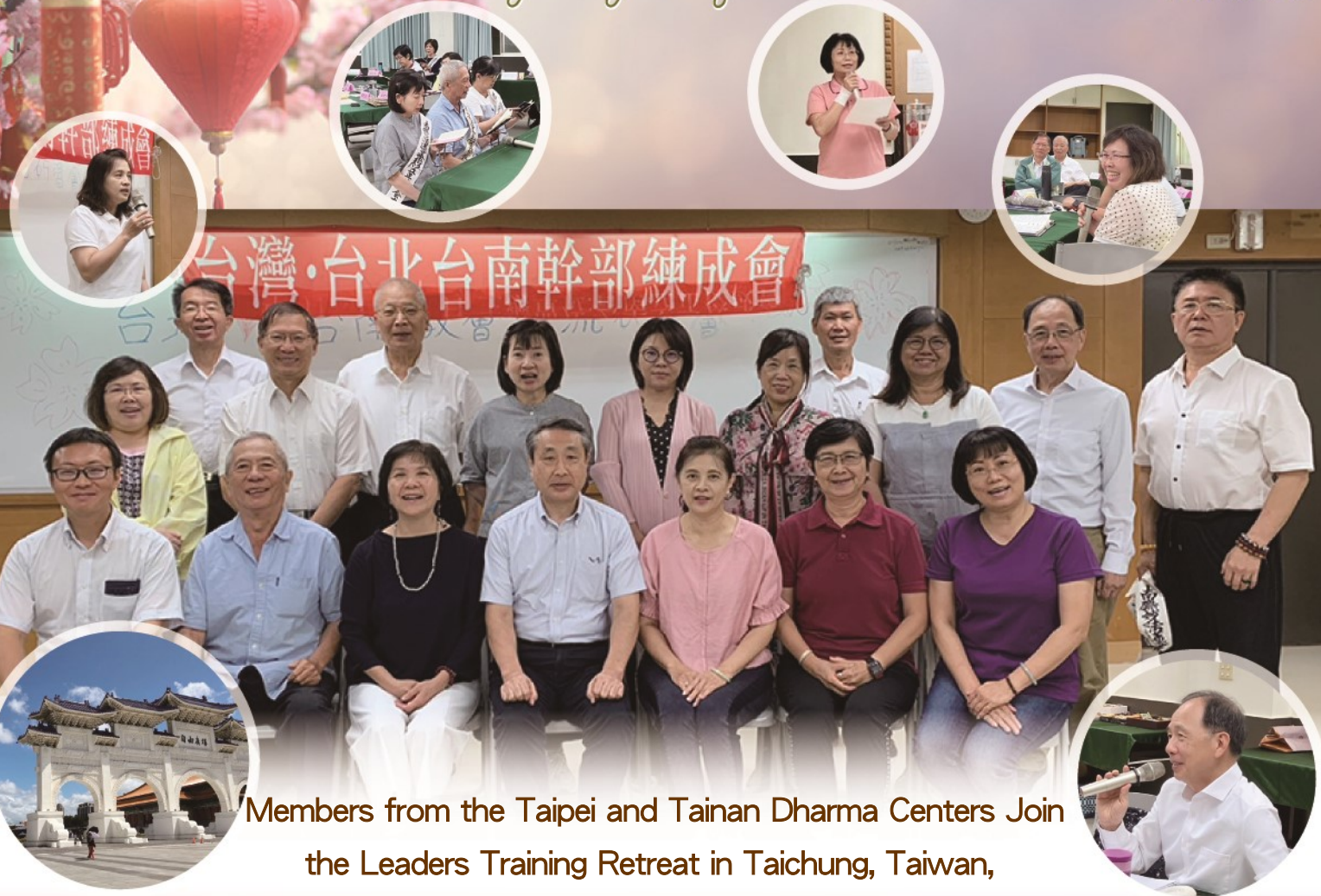
Members from the Taipei and Tainan Dharma Centers Join the Leaders Training Retreat in Taichung, Taiwan, from September 8 to 10, 2024