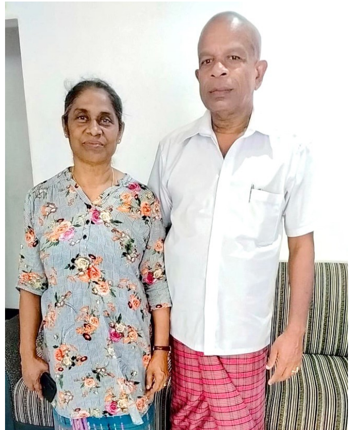
在自家與先生合影

《我為自己的出生感到非常高興。能夠透過教師的工作與佼成會結緣，與《法華經》相遇，並且參拜大聖堂》。我的腦海裡閃過種種念頭，心裡充滿了感激。