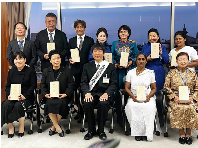
在大聖堂舉行的教師授予儀式之後，與海外教會的授領者（前排右起第2位）