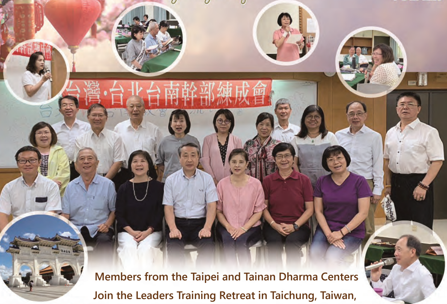
Members from the Taipei and Tainan Dharma Centers Join the Leaders Training Retreat in Taichung, Taiwan, from September 8 to 10, 2024

Living the Lotus Vol. 229 (October 2024)