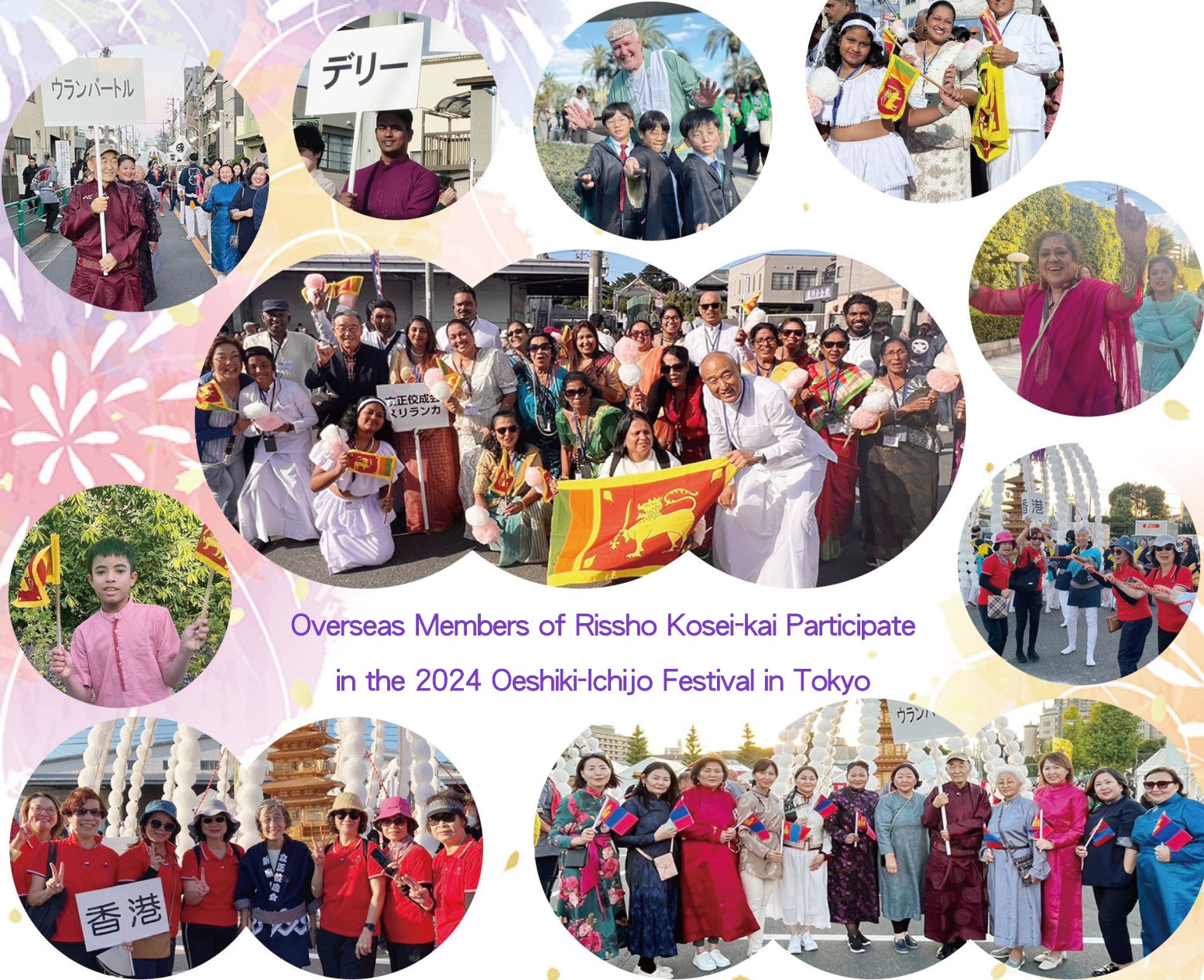
Overseas Members of Risho Kosei-kai Participate in the 2024 Oeshiki-Ichijo Festival in Tokyo

Living the Lotus Vol. 231 (December 2024)