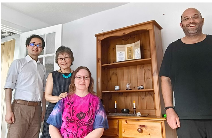
在倫敦中心會員家的御寶前和僧伽一同

用言語來表達這段經歷是非常困難的，但實際上，在2020年9月，我患有精神疾病的兒子突然選擇結束了自己的生命。他當時才21歲，正值青春年華。他一直深受憂鬱症的困擾，但遺憾的是，我無法將他從痛苦中拯救出來。失去兒子的巨大打擊和深深的失落感讓我無法自拔，我一次又一次地責怪自己，問自己：「為什麼我無法成