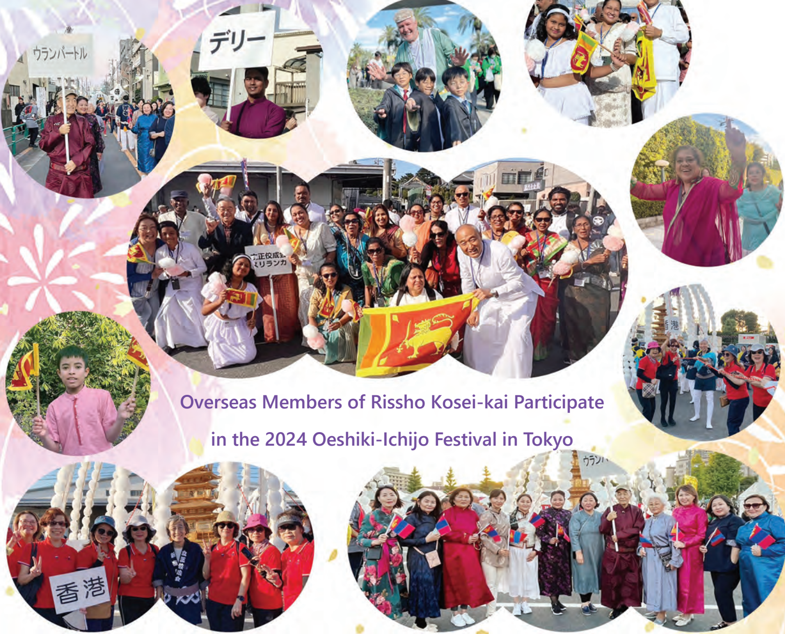
Overseas Members of Risho Kosei-kai Participate in the 2024 Oeshiki-Ichijo Festival in Tokyo

Living the Lotus Vol. 231 (December 2024)