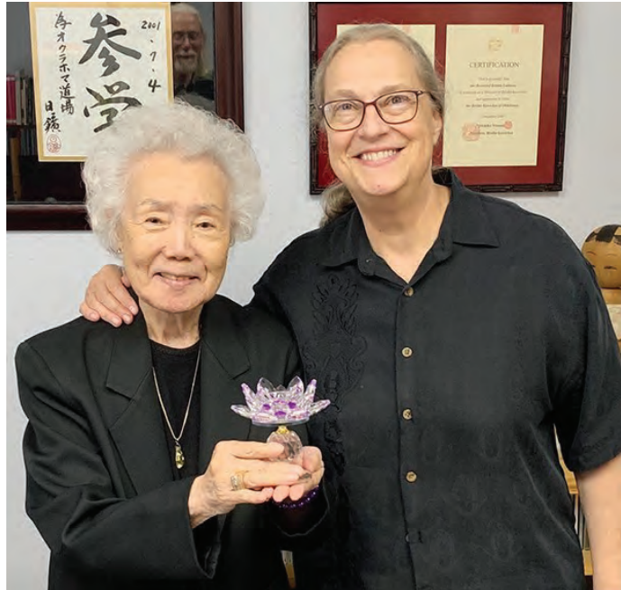
හිල්ඩාබ්‍රැන් ඔක්ලෝහෝමා ශාඛාවේ මුල්ම කියෝකයවෝ සාන් සමග

මවගේ සොහොන සොයාගැනීමට ඇය සුසාන භූමියට ගිය අවස්ථාවේ එහි භාරකරු විසින් මවගේ අනතුර ගැන මතකයේ තිබී ඒදින සිද්ධිය ගැන පොලිස් වාර්තා ඇයට පෙන්වුවා. එහි, මව වාහනය පදවමින් තිබූ දිශාවට විරුද්ධ දිශාවෙන් වැරදි ආකාරයට පැමිණෙන වාහනය තම රථයේ ගැටීම වළකා ගැනීමට සහ එම වාහනයට ඉඩ ලබාදීමට සිතා හදිසි තිරිංග යෙදූ අවස්ථාවේ වාහනය පාලනය කරගත නොහැකිව පාලමෙන් වැටී තිබුණු බව ලියා තිබුණා. ඒ අනුව තම මව සියදිවි හානිකරගෙන නොමැති බවත් ඉදිරියෙන් පැමිණි වාහනයට ඉඩ දීමට ගොස් අනතුර වූ බවත්, එම රියදුරුගේ ජීවිතය බේරුණු බවත් දැනගන්නට ලැබුණා. ඒදින සිදුවීම ගැන නිවැරදිව දැන ගැනීමත් සමග ඇය තම මව දෙස බැලූ ආකාරය හාත්පසින්ම වෙනස් වූවා. පසුව, අවුරුදු 50 ටත් වැඩි