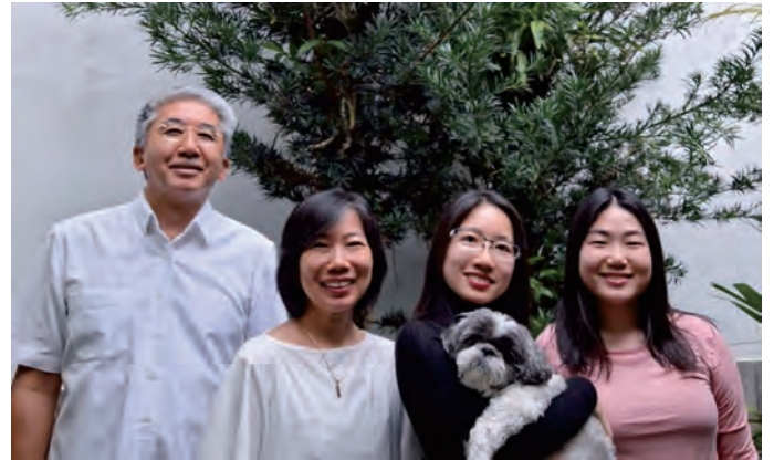
與先生和兩位女兒，還有愛犬合照

真正的幸福，祈禱他人的幸福，為了他人而努力的重要性。換句話說，我認為這是根據教義自己成為菩薩的精進。為了祈願他人的幸福，透過實踐菩薩行讓自己成長，成為能夠為他人實踐菩薩行的自己。「首先為他人」的心，我是這樣理解的。