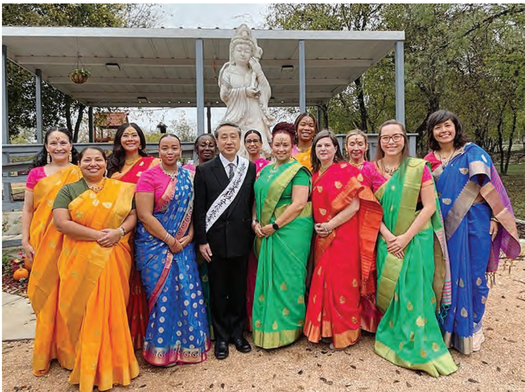
2024 оны 12 сарын 8-ны өдөр Сан Антонио салбарын нээлтийн ёслолоор цэцэг өргөсөн гишүүдийн хамт

2-р сард Буддын шашны гурван том баярын нэг болох “Бурхан багшийн нирваанд орсон өдрийн ёслол” болох ба Косей кай нийгэмлэг ч гэсэн Их Ариун Ордонд томоохон хэмжээний үйл ажиллагааг зохион байгуулна. Үүгээр дамжуулан би Бурхан багшийн нирваан дүр үзүүлсэний утга учрыг тунгаан бодож, гэргийтэн хүний хувиар өдөр бүр бурхны үйлд хичээнгүйлэн зүтгэхээ дахин тангараглахыг хүсэж байна. Нивано ерөнхийлөгчийн энэ сарын айлдвараас “Бид хэдий чинээ өсөж сайжирна төдий чинээ гэрэлт ирээдүйг бүтээж чадна.” гэдгийг суралцлаа. Үүний тулд хэрхэн Цагаан лянхуа судрыг амьдралдаа хэрэгжүүлэхээ тунгаан бодож, сургаалаар дамжуулан аз жаргалыг мэдрэхийн тулд өдөр тутмын амьдралдаа бие, хэл, сэтгэлээрээ сургаалыг дагахын хамтаар могой жилд хуучны өөрөөсөө салж урагшлан сайжрахыг хичээх болно.