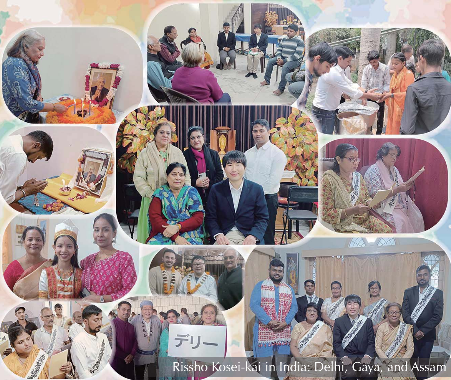
Rissho Kosei-kai in India: Delhi, Gaya, and Assam