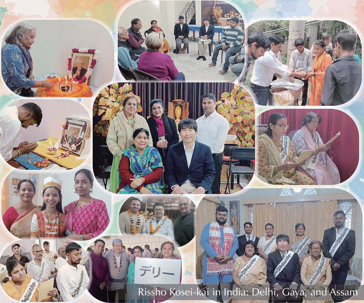
Rissho Kosei-kai in India: Delhi, Gaya, and Assam