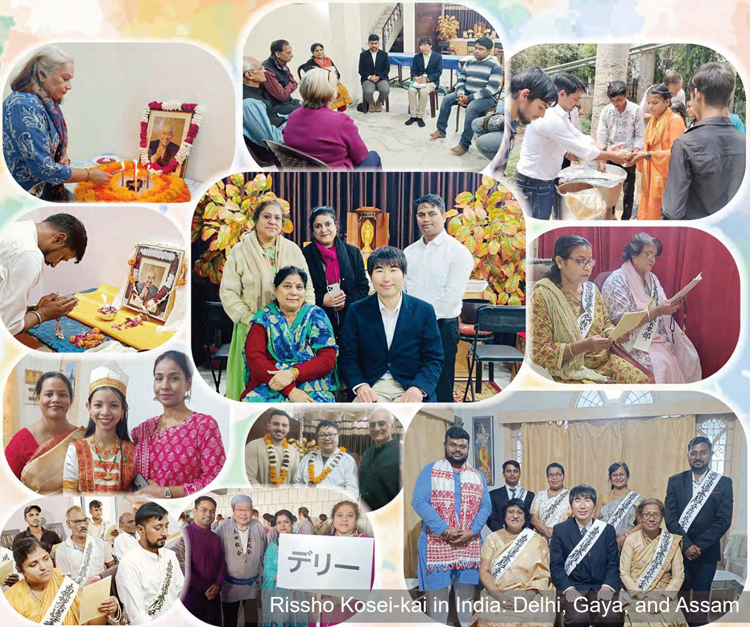
Rissho Kosei-kai in India: Delhi, Gaya, and Assam