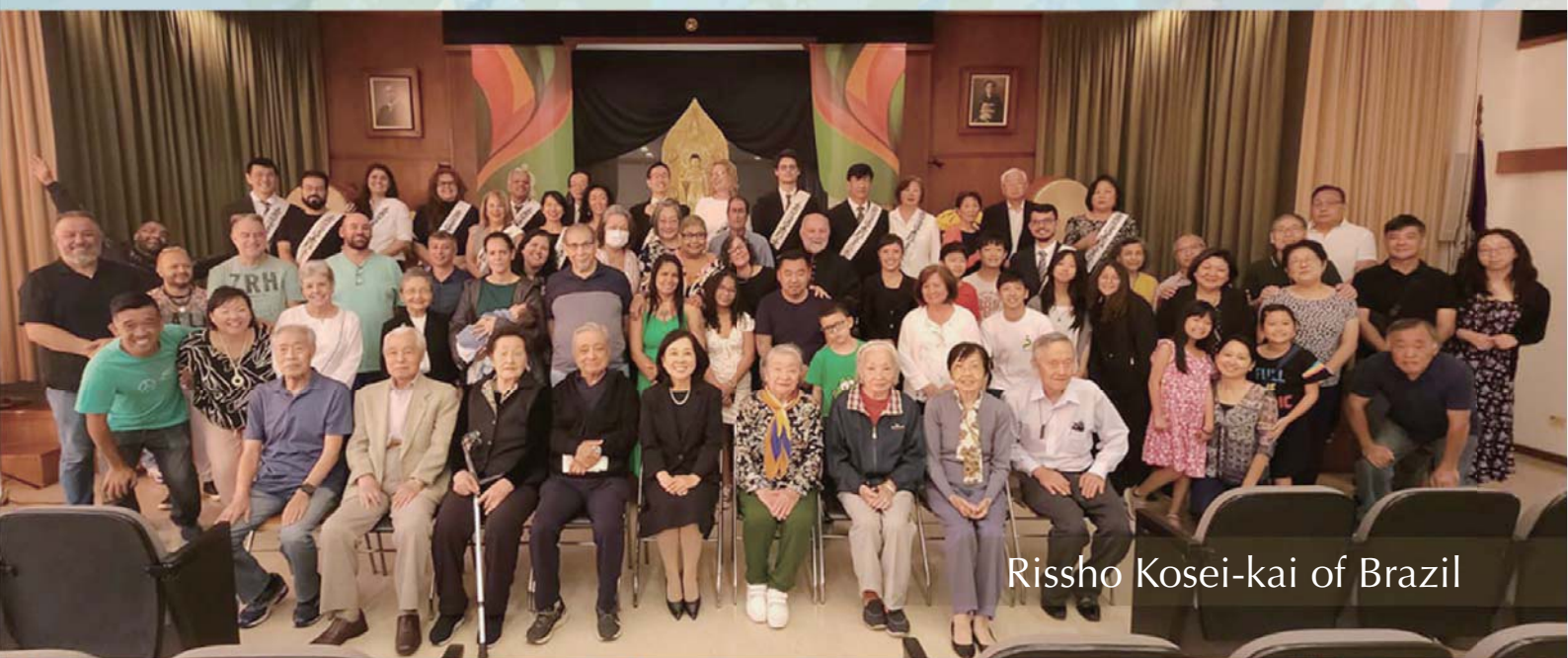
Rissho Kosei-kai of Brazil