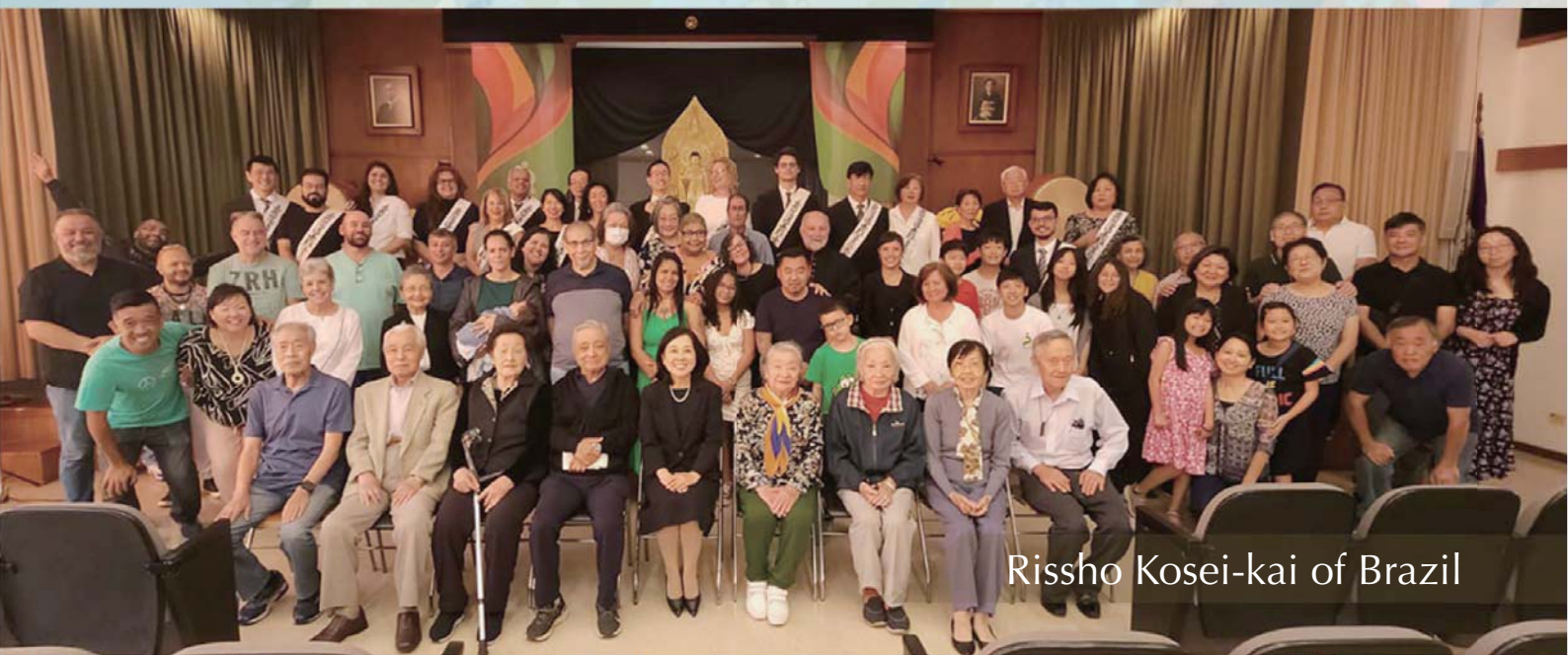
Rishsho Kosei-kai of Brazil