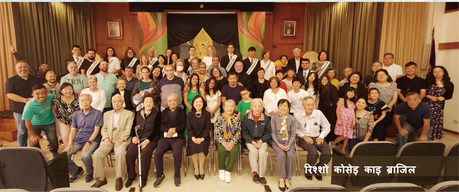
रिशो कोसेइ काइ ब्राजिल