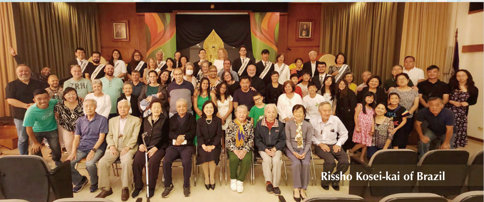
Rishso Kosei-kai of Brazil