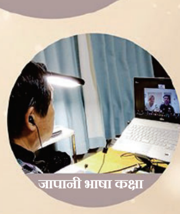
जापानी भाषा कक्षा

Living the Lotus Vol. 243 (December 2025)