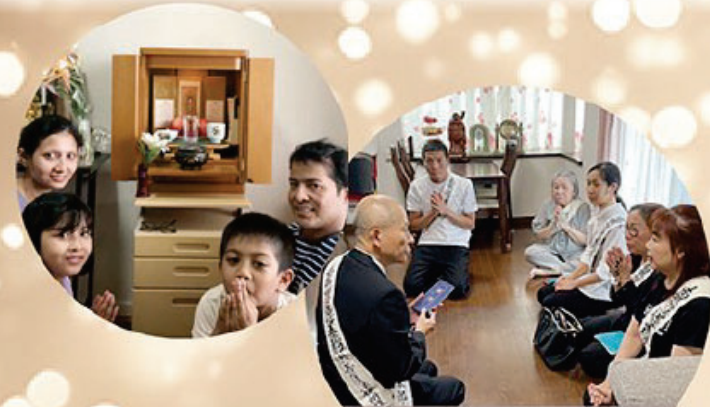
सदस्यको गृह भ्रमण

रिश्शो कोसेई-काई अन्तर्राष्ट्रिय बौद्ध चर्च (IBC) विदेशी बासिन्दाहरूको हृदय जोड्ने बौद्ध समुदाय