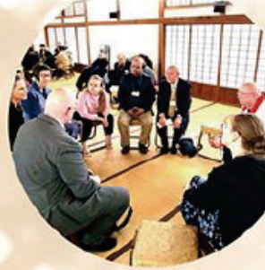
टोकियो राष्ट्रिय संग्रहालय भ्रमण