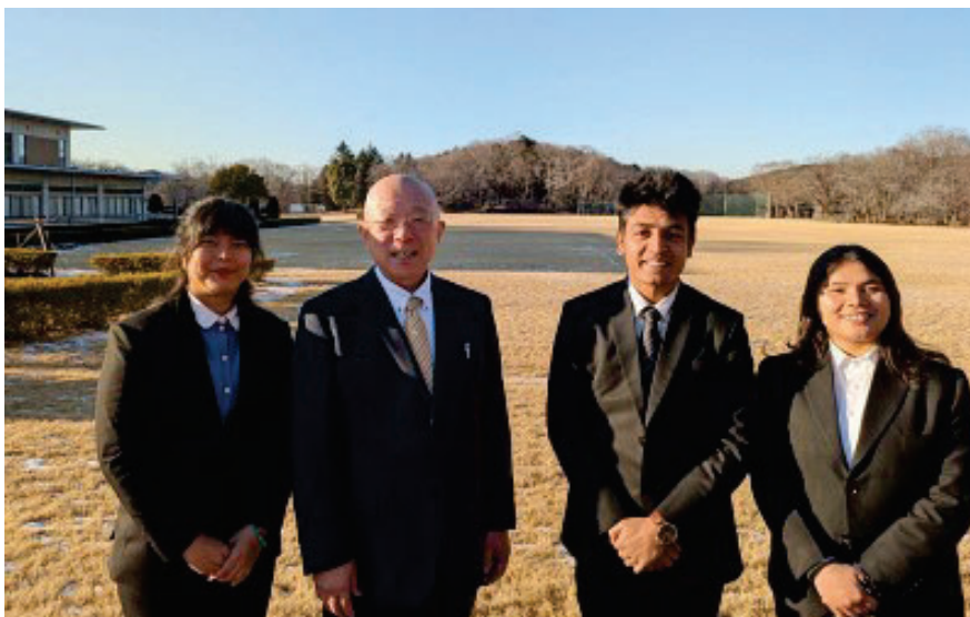
Гакурин сургуулийн гадаад оюутны 2-р курсийн сурагчидтай хичээлийн дараа зургаа авхуулсан нь. 2 сарын 9

Байгууллагын ойн баяр тохиох энэ сард “бүгд нэгэн бүхэл” гэсэн үндэс суурь рүүгээ эргэн очиж, бурхны сургаалыг өдөр тутмын амьдралдаа хэрэгжүүлэх нэг алхмыг хамтдаа хийцгээе. Өмнөх үеийнхэндээ талархаж, тэдний хүсэл зорилгыг уламжлан авч, өнөөдөр түүний төлөө замнах нь бидний үүрэг билээ.