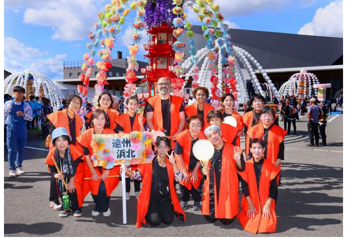
2025年10月12日，與參加生誕地祭典的濱北教會會員合影（後排中央）

無論翻譯任何文章都是如此，尤其是在翻譯《法華三部經》時，我們嚴選最適合的義大利語表達，力求每一個詞句的意義都能準確且完整地傳達。此外，對於容易引起誤解的詞語和表達，我們也謹慎地選擇譯詞。最重要的是，我們並非學者，因此不僅為立正校成會的會員，也為現代生活中的人們，盡量使用淺顯易懂的語言，讓法華經成為「活生生的教義」，能夠在日常生活中實踐。我們反覆與大家討論，努力使譯文符合佛陀