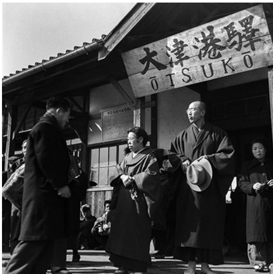
訪問地方佈教的開祖恩師與脇祖恩師（1952年，茨城縣）

如果思考當今日本，大多數人最渴求的是什麼，說到底，無非是心靈上的安寧，以及精神上的豐足。人們尤其關心人際關係，希望和身邊的人保持和諧的心靈交流——這大概是多數人的共同願望吧。