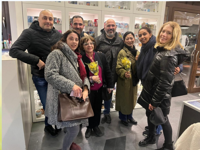
與羅馬法座的僧伽們（從右數第四位）

的戰事至今仍未平息，世界遺憾地陷入日益加深的分裂與對立，混沌局面然持續著。過去曾透過脇祖恩師傳達的「以立正佼成會為根基，將法華經廣傳至世界各國」的神示，而我深切感到，正是在今日，立正佼成會肩負著向世界弘揚法華經教義的使命與任務。基於這樣的認知，此刻我最殷切的願望，便是以羅馬為中心，致力於僧伽們的團結，成長與發展，並以此為基礎弘揚法華經，這無非是我們每個人都具備佛陀的智慧與慈悲，並將教義傳達給更多人。此外，雖然理想非常宏大，但我個人的夢想是能在羅馬擔任教會長。為此，我將比以往更加努力，在日常修行中學習並實踐法華經，同時與僧伽的各位齊心協力投入布教傳道，努力引導更多義大利人走向幸福。