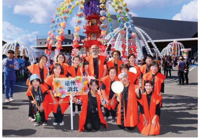
2025年10月12日、生誕地まつりに参加した浜北教会の会員と（後列中央）

法華経は難解な語句が多く、また深遠な教えを翻訳するにあたって大変なご苦勞をされたことと思いますが、特にどのような点に留意されてきましたか？