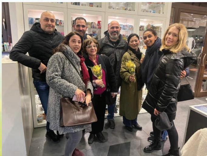
ローマ法座のサンガと（右から4人目）

ウクライナやパレスチナではいまだ戦闘が長期 化し、世界は残念ながら分断と対立が進み、混沌 とした状況が続いています。かつて脇祖さまを通じ て「立正佼成会をもととして法華経が世界万国に 広まる」という神示がありましたが、私は今日こそ立 正佼成会が世界に向かって法華経の教えを広め る使命と役割があると強く感じています。そうしたこ とを踏まえ、今、私がいちばん願っているのは、 ローマを中心にしてサンガの結束と成長・発展を 目指して、法華経を布教していくこと——それは 私たち一人ひとりが仏さまの智慧と慈悲を身につ け、多くの人々に教えを伝えていくことにほかなり ません。また理想はとても大きいのですが、夢は ローマで教会長をさせていただくことです。そのた めにもこれまで以上に日々の修行の中で法華経 を学び、実践するとともに、サンガの皆さんと力を 合わせて布教伝道に取り組み、多くのイタリア人を 幸せに導いていけるよう精進していきたいと思っ ています。