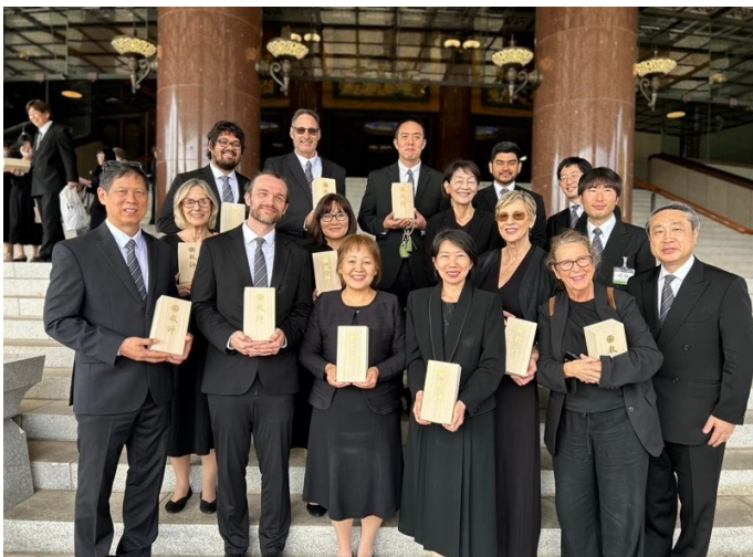
2024년10월27일, 대성당에서 열린 교사수여식 후에 함께 교사자격을 수여받은 해외 교성회 수여자와 함께(마지막줄 왼쪽에서 두번째)

2024년6월에 전미영어간부교육이 로스앤젤레스에서 개최되었습니다. 그곳에서 이전에 법화경 세미나에서 함께 공부했던 동료들과 다시 만나게 되었습니다. 법화경 세미나에 참가했던 2018년은 알코올 의존증으로 괴로워했던 시기로, 저는 항상 막연한 불안감에 휩싸여 있었으며, 행복도 느끼지 못하고 몇 번이나 교성회를 그만두고 싶다는 생각을 하고 있었습니다. 그로부터 6년후인 간부교육 첫날, 독경공양때 도사 역할을 받았습니다. 역할을 하면서 당시의 제 자신의 모습이