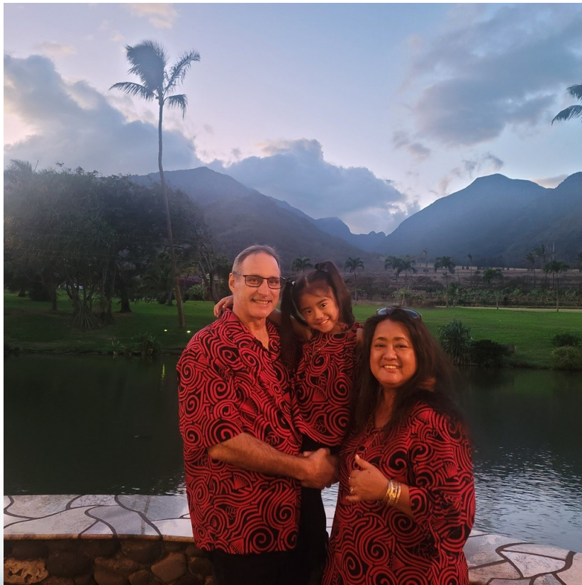
부인인 키나씨와 조카와 함께

저의 가장 큰 바람이고 목표로 하고 있는 것은, 모든 사람이 구제받는 범화경 가르침을 더욱 많은 사람들에게 전달하는 것입니다. 회원들 간의 관계를 보다 견고하게 해서, 지금 구제를 필요로 하고 있는 사람들을 새로운 승가로 맞이할 수 있도록 포교해 나가고 싶습니다. 그리고 앞으로, 어떠한 역할도 모두 저의 성장에 필요한 역할이라고 믿고, 기쁨과 감사하는 마음으로 받겠다고 결의 합니다.