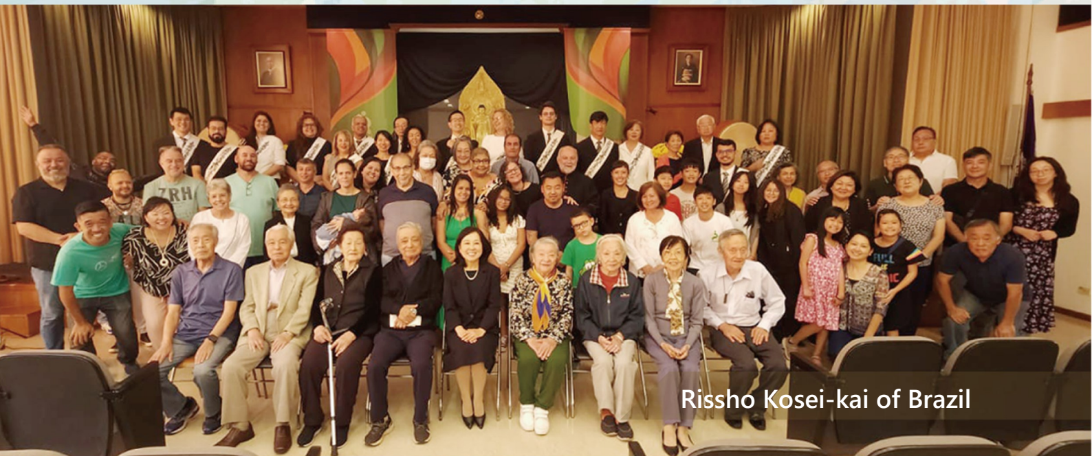
Risho Kosei-kai of Brazil